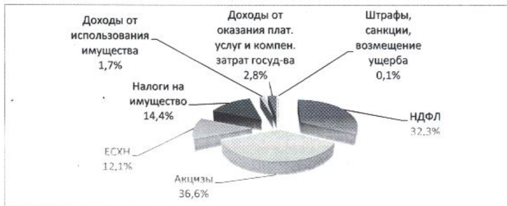
Рис.1: Структура собственных доходов бюджета Червленовского сельского поселения за 2022 год

Фактическое поступление налоговых и неналоговых доходов за 2022 составило 10 408,9 тыс. рублей бюджетные назначения исполнены на 109,1% по сравнению с прошлым годом, поступление доходов уменьшилось на 288,1 тыс. рублей или на 2,7%.