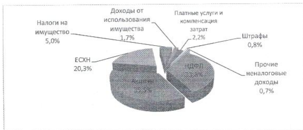
Рис.1. Структура собственных доходов бюджета Червленовского сельского поселения за 9 месяцев 2023 года

Структура собственных доходов бюджета Червленовского сельского поселения за 9 месяцев 2023 года представлена на рис. 1.