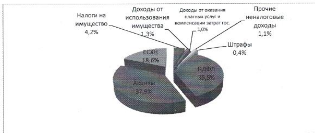
Рис.1. Структура собственных доходов бюджета Червленовского сельского поселения за I квартал 2023 года

Структура собственных доходов бюджета Червленовского сельского поселения за I полугодие 2023 года представлена на рис. 1.